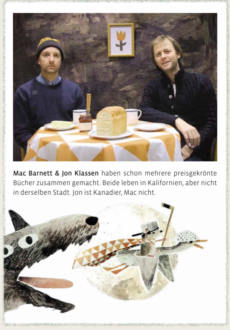
Mac Barnett & Jon Klassen haben schon mehrere preisgekrönte Bücher zusammen gemacht. Beide leben in Kalifornien, aber nicht in derselben Stadt. Jon ist Kanadier, Mac nicht.