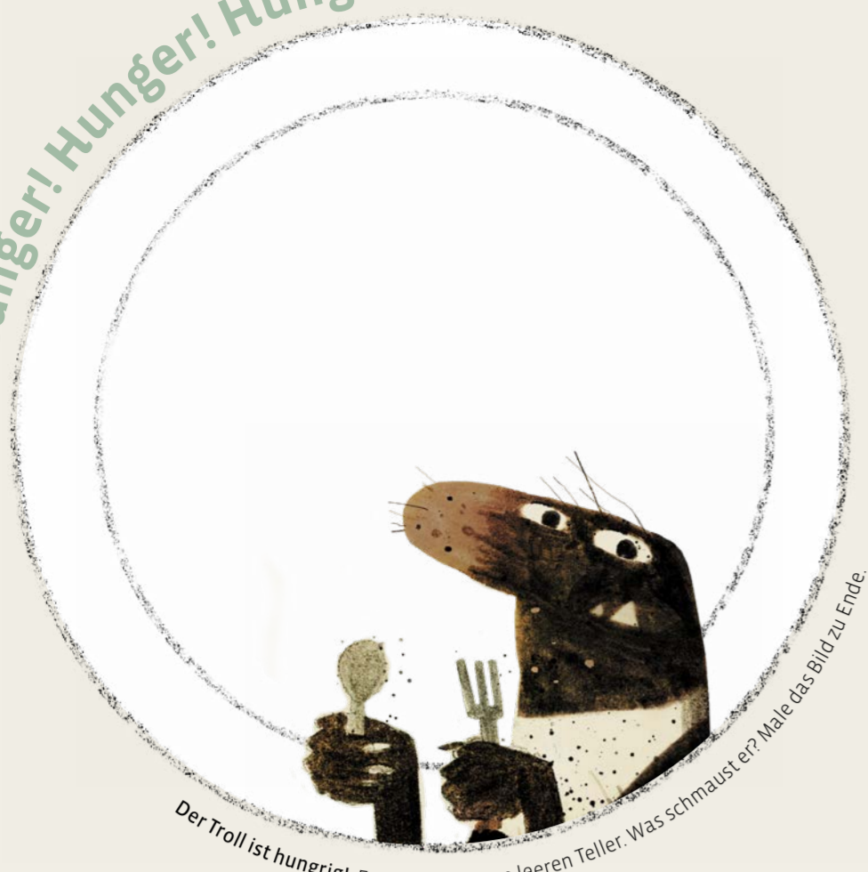
Der Troll ist hungrig! Er sitzt vor einem leeren Teller. Was schmaust er? Mac's Bild zu Ende.