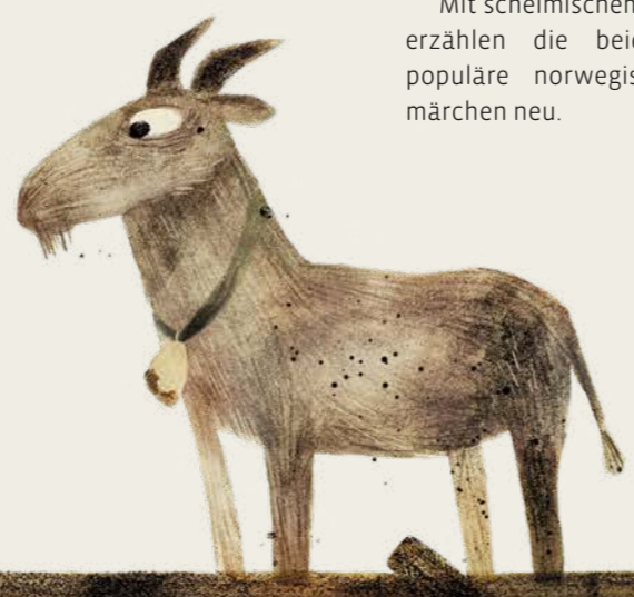
Drei Ziegenböcke namens Zack 48 Seiten, ab 5 Jahren ISBN: 978-3-314-10650-7

sehr zum Vergnügen der Leser. Vor mehr als 10 Jahren feierte Jon Klassen mit »Wo ist mein Hut« sein Debüt im Verlag. Seither sind mehr als 10 Bücher erschienen, viele davon zusammen mit dem kongenialen Autor Mac Barnett. Mit schelmischem Vergnügen erzählen die beiden dieses populäre norwegische Volksmärchen neu.