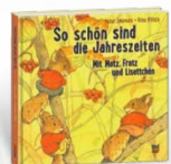
So schön sind die Jahreszeiten Sammelband 112 Seiten / ab 4 Jahren ISBN: 978-3-314-10401-5